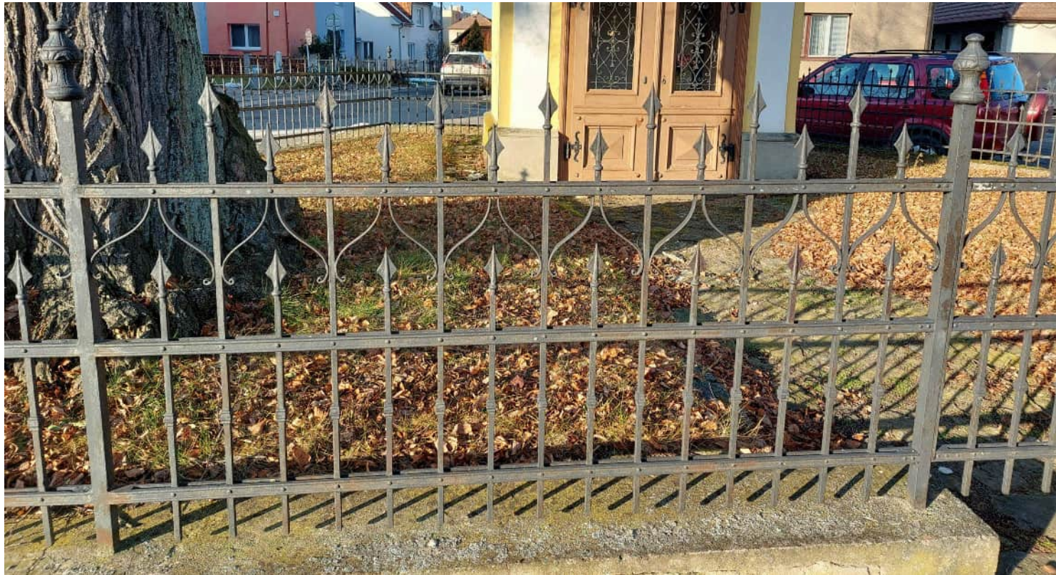
Kovaný plot i brána budou podobného charakteru jako u blízké kapličky